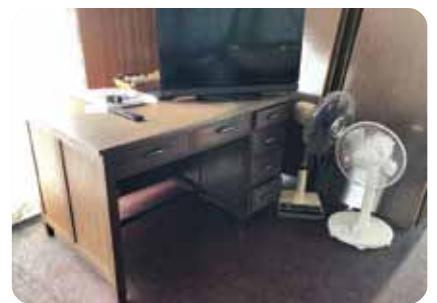
集会所には、芳川小学校で使われていたという教員の机が存在感を見せている。

田 野々の街から榑原川沿いに国道439号を走り始めると、すぐに江師トンネル、続いて小石トンネルをくぐる。そこから500mほど行くと芳川への右折表示が現れる。川の内側のバス停があるところである。表示に従って右折し、芳川川沿いを東に入っていく。最初にある集落は川の内地区であるが、さらに車を走らせると芳川地区となる。川に沿って点在する人家を通り過ぎながらしばらく行くと、少し開けたところに出る。そこに地区の集会所がある。国道から3kmほど入ったところで、以前は芳川小学校があったところである。芳川小学校は、今から50年ほど前に閉校となった。 この小学校跡の裏山が国有林で、林業が盛んだった頃には大正管林署芳川事業所があり、地区にはその職員の家族たちが多く住んだ。児童もたくさんいて、年に一度の運動会には、たくさんのお客さんが来て、それは賑やかだったという。また、地区には食料品店などの商店もあった。当時は木炭の生産が主力で、検査員による品質検査を終えた生産者の元には、業者から委託された銀行員が直接代金を支払いに回ったそうだが、木炭の生産が下火になると、乾燥椎茸の生産がそれに取って代わった。 ところでこの芳川の国有林であるが、前回、下津井の回でも記したのと同じ、良質の山林として土佐藩から指定された「御留山」の一つであった。初めは名本という役職が置かれていたが、その後庄屋支配に格上げされ、地区の広大な御留山の管理に当たった。