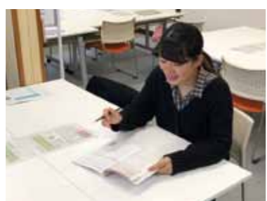
▲今日も生徒たちに会うのが楽しみです!

ご出身は、富士山を南側に見る山梨県富士河口湖町。地元の小・中学校を卒業して、高校は山梨英和高等学校。なんとスクールバスで片道2時間の通学だったそうです。英和高校を選んだ理由は、姉妹校である韓国の学校との交換留学制度があったから。