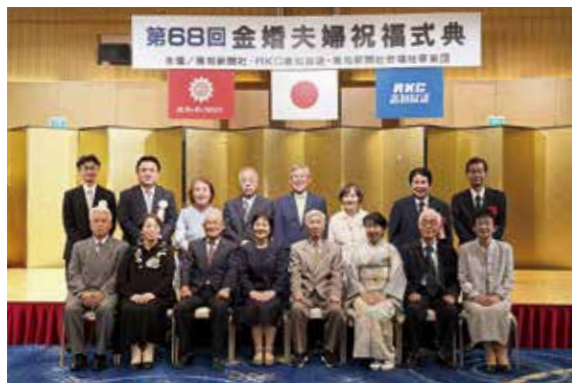
金婚式典に出席した6組のご夫婦を祝して記念の一枚

法務省主唱の「社会を明るくする運動」事業の一環として、「第65回高幡子ども会親善ソフトボール大会」が、7月13日に四万十町窪川運動場で開催されました。県内から参加した9チームが、3つのゾーンに分かれて予選リーグを戦う中、途中、降ってきた雨がさらに強まり、大会は別日へと延期となりました。そして迎えた9月7日、予選の残り試合と決勝戦を開催。決勝戦では、高知ジュニアソフトボールクラブが池川子ども会をタイブレークの末、5対4で破り見事優勝を果たしました。