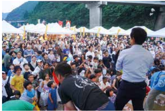
餅まきでは来場者が河原を埋め尽くした