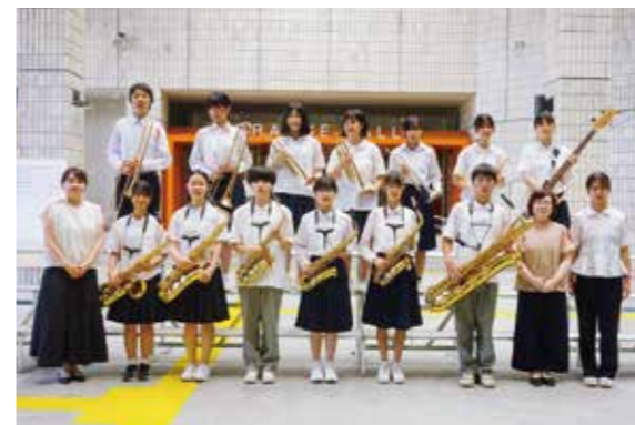
FAIRY PITTA JAZZ ORCHESTRAの皆さん

陸上部3名の選手が県大会で見事入賞し、愛媛県で開催された四国中学校総合体育大会に出場。3名とも暑い中、ベストを尽くし頑張ることができました。惜しくも、入賞とはなりませんが、この経験を次につなげてもらいたいものです。