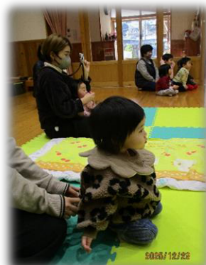
おにいちゃん・おねえちゃん とっても上手だったね♪

12/23 クリスマスの歌を聴こう♪ 認定こども園たののの幼児組のお友だちが、 ハンドベル演奏や、ダンスを披露してくれました♪ ハンドベルのきれいな音色に、ひろばのお友だちは聴き入っ ていました♪ダンスもとっても上手でした☆ クリスマスの雰囲気を楽しむことができました◎