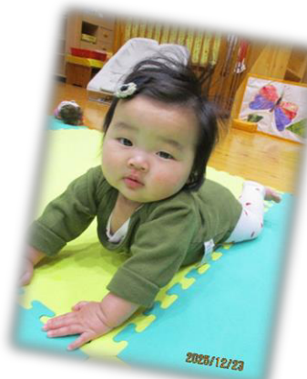
寝返りもバッチリ！