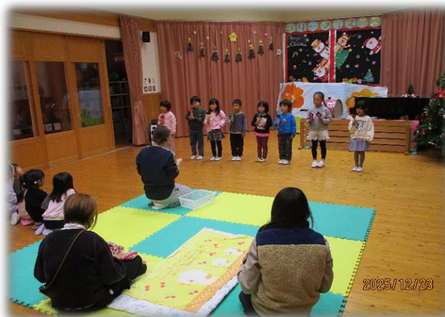
ハンドベル演奏、とってもキレイでした♪

12/23 クリスマスの歌を聴こう♪ 認定こども園たののの幼児組のお友だちが、 ハンドベル演奏や、ダンスを披露してくれました♪ ハンドベルのきれいな音色に、ひろばのお友だちは聴き入っ ていました♪ダンスもとっても上手でした☆ クリスマスの雰囲気を楽しむことができました◎