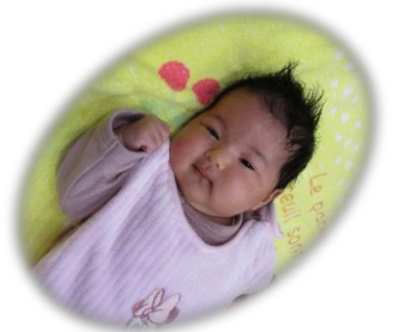
たくさんあそぼうね〜♡

はじめましてのお友だちです◎ ほっぺがとってもぶにぶにでした♡ たくさん遊びに来てね◎