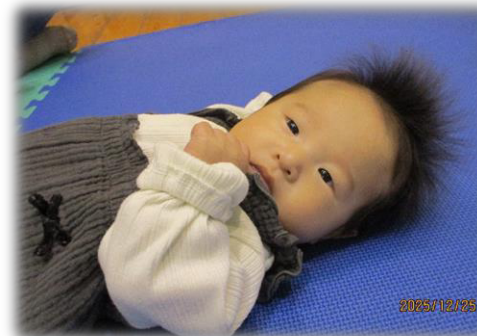
みんな、なかよくしてね〜