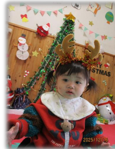
トナカイさんになったよ♡