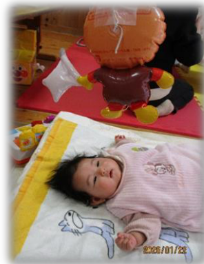
アンパンマンがみえるぞ！