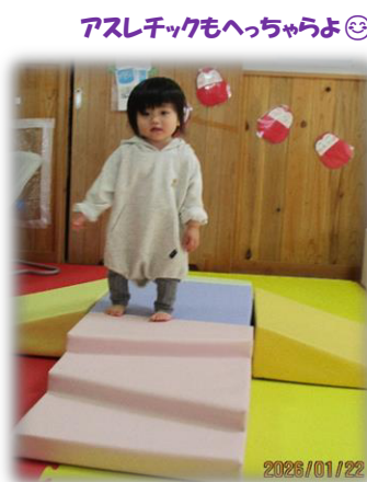
アスレチックもへっちゃらよ😊