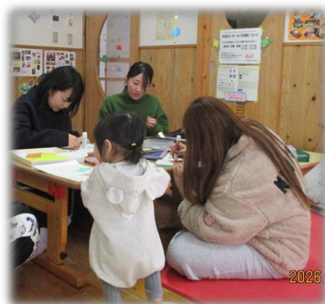
お母さんたち、製作中〜