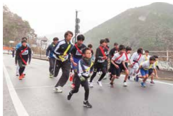
小雪が舞う中、1区のランナーが一斉にスタート