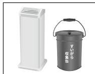
たばこの吸い殻 など残り火の確実な処理