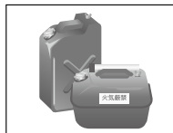
可燃物 付近での喫煙