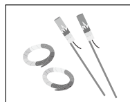
花火など 煙火の使用