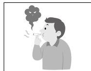
山林、原野 などでの喫煙