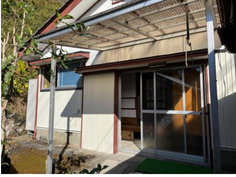
リビング横 出入口