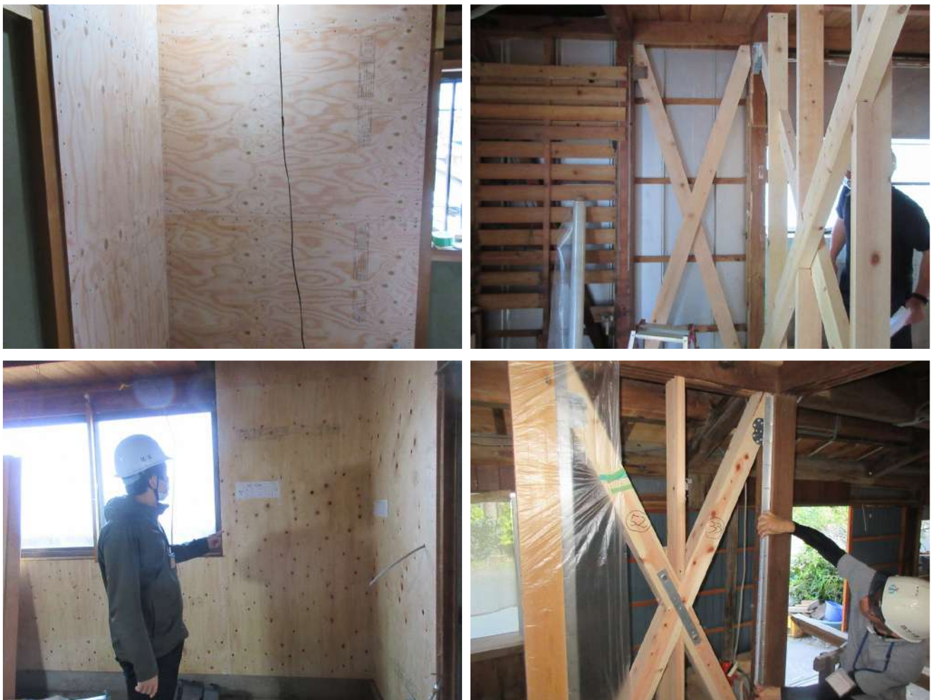
【図表】 耐震改修工事の例