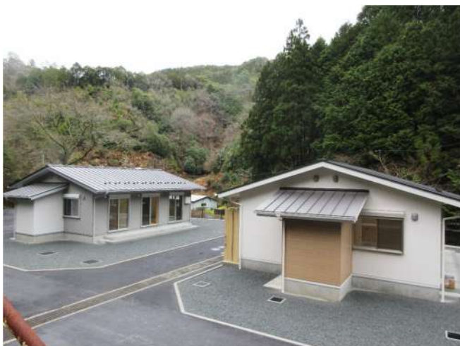
【図表】 八木第2団地(令和5年度建替)