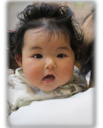
ママの肩からこんにちは☺