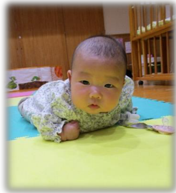
うつぶせ頑張ってるよ～