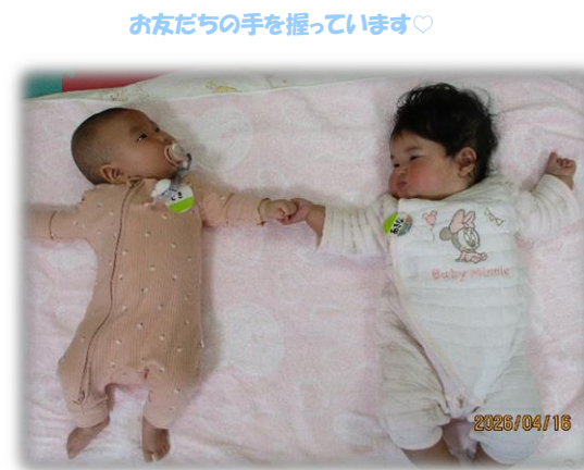
お友だちの手を握っています♡