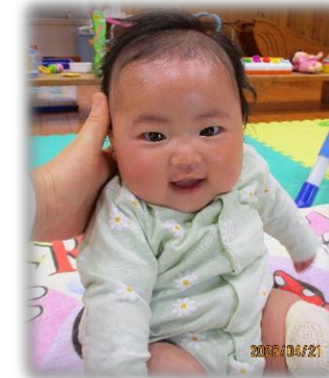
にっこり笑顔がかわいいわ♡