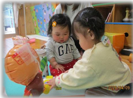
いっしょにあそぼうね～