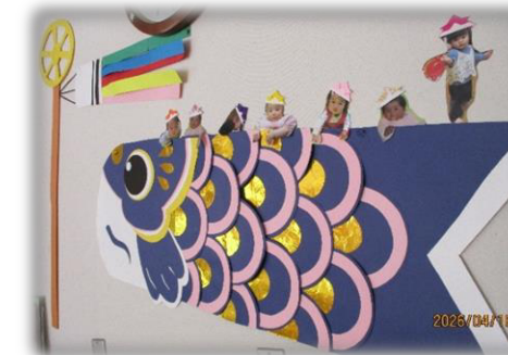
支援センターのお部屋の 大きなこいのほりに お友だちが乗っていますよ～