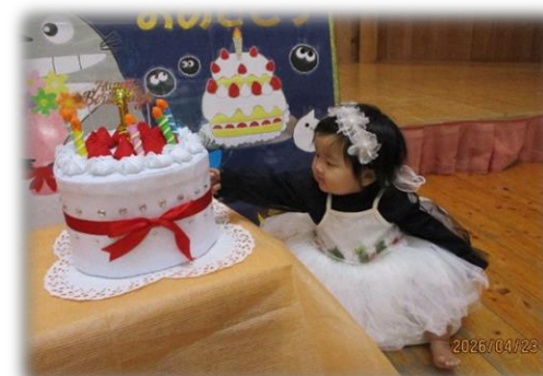
ケーキさわってみよ♡