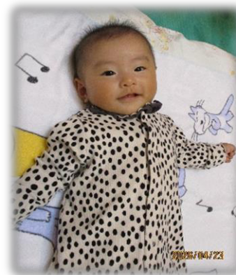
カメラを向けるとにっこり笑顔♡