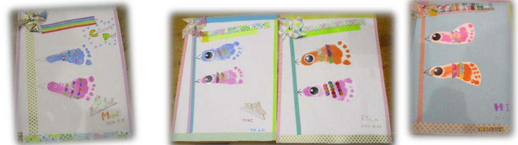
お子さんの足形をとって、こいのほりをつくりました。小さな足形がとっても可愛いですね♡