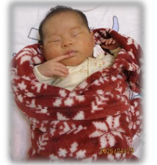
→ やっばいねんねしようZZZ