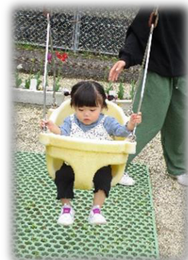
ブランコはちょっと怖かったよ