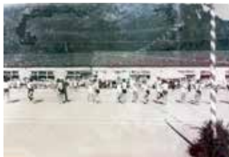
昭和48年頃の小中合同運動会

前号で「1951(昭和26)年に、現在の国道に沿う形で東西に長い校舎が新築された」と書いた。グラウンドは校舎の南側、つまり現在残っている小中学校のグラウンドと同じ場所であったが、1973(昭和48)年までは、現在よりも2mほど低く、校舎からは数段の階段を降りたところにあった。同年、ここに盛り土をして現在の高さになったのである。さて、その盛り土