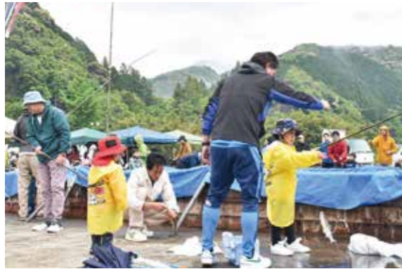
雨の中、あめごと一緒に大はしゃぎ