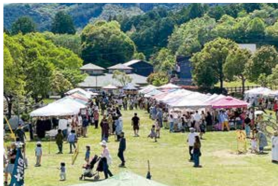
快晴の中、多くの来場者でにぎわう出店テント

祭りのために特別に設置された釣り堀（あめご釣り）や、ふわふわ遊具（エアートランポリン）などに加え、鉄道ホビートレイン型バッテリーカーが初お披露目となり、アトラクションが家族連れを中心に大好評でした。出店やキッチンカーによる飲食販売も行われ、来場者は雨の中でもイベントを楽しんでいました。