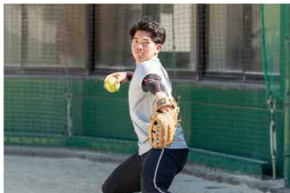
高知パシフィックウェーブでの練習風景