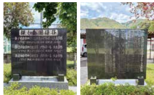
ソフトボール全国制覇の記念碑。 4回目以降のために左側にスペースが設けられた

2015年3月、昭和中学校の歴史はその幕を閉じた。そこにはいつも子どもたちがいた。そこに学校があった。(おわり)