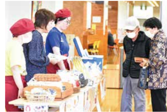
就労継続支援事業所が製作した商品を販売