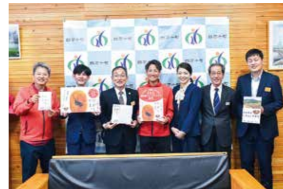
町の味を全国へ、JAL採用を祝い町長を囲んでにっこり

主催者は「次回は7月開催予定です。事業所の頑張りをぜひ見に来てほしい」と語っていました。