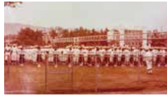
県大会初出場を果たした野球部時代

これまた北ノ川と同様、ソフトボール部の前身は野球部であった。1974(昭和49)年3月、県選抜野球大会幡多地区予選で好成績を上げ、初の県大会に出場した。今のように国道が整備されていない時代である。大方で行われた幡多地区