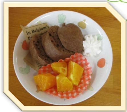
この日のおやつと離乳食です😊