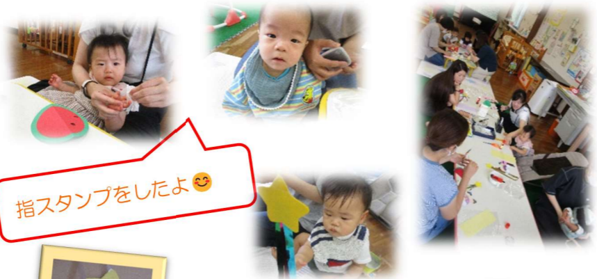
指スタンプをしたよ😊