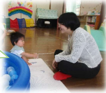
日本語がとても上手な ダンヒ先生😊