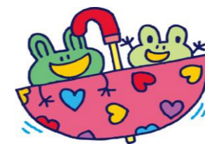
お母さんたちの話も盛り上がりします😊