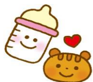
いっしょにあそぼう~