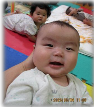
にこにこ笑顔がかわいいね♡