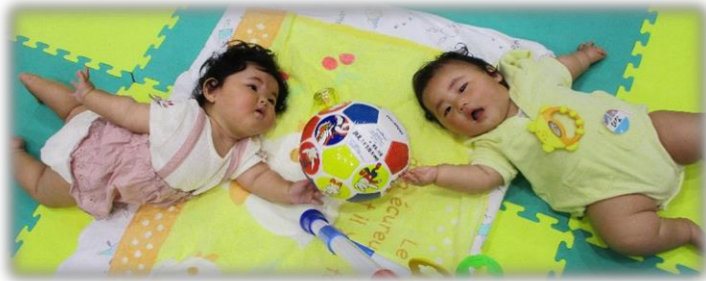
一緒にボールを持つよ😊