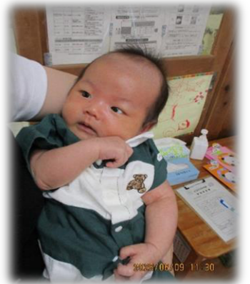
お兄ちゃんに会いにきたよ😊