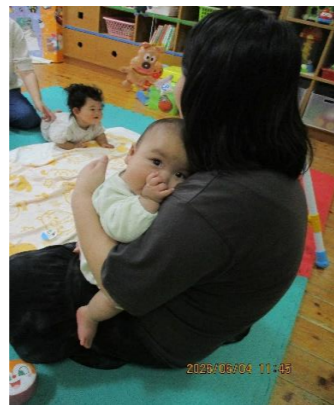
眠たくなってきちゃった~