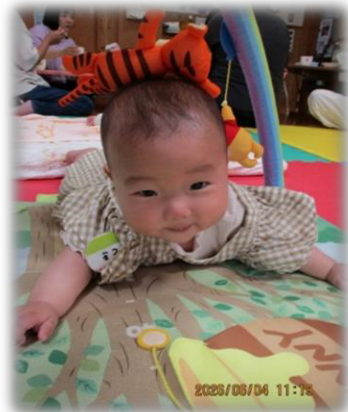
あれ? 頭に何か乗ってるぞ