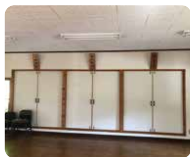
集会所内で仲良く並んでいる 「河内神社」「八坂神社」「観音堂」

寺野地区の産土神(氏神様)は河内神社である。地区にはもう一つ、八坂神社がある。これは、明治初期、寺野村一帯で流行り病が蔓延し、その収束を願った村人が、京都の八坂神社に分祀を願い出したことにより建てられた。年配の方は親しみを込めて「祇園さん」と呼ぶ。さらに、地区には観音堂というお堂がある。このお堂は、元は窪川村にあった禅寺「東光寺」の末寺・昌隆寺(正龍寺と記す地誌もある)である。江戸時代にはすでに退転(廃寺)していたようであるが、本尊であった如意輪観音は保存され、今もお堂で大切に祀られている。実