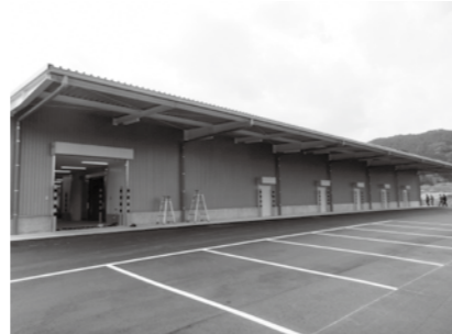
「強い農業づくり総合支援事業」で整備された野菜集出荷場

整備から約35年が経過していた三島キャンプ場のリニューアル整備工事を行いました。老朽化した施設を新たに整備したことで、施設の安全基準を満たすことができ、利用者が快適に過ごすことができる環境を整えました。