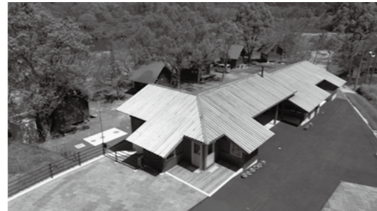
「十和観光施設整備事業」でリニューアルした三島キャンプ場

健やかに学習・生活ができる環境整備の一つとして、学校トイレの洋式化・乾式化を実施しました。