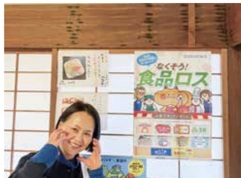
事業所に掲示してもらったポスター