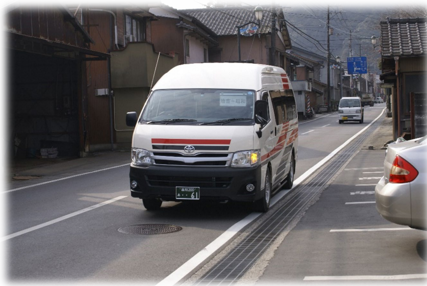
写真：十和地域でのコミュニティバス実証運行 [平成 23 年]

今後は、新たな課題である「高速道路網の充実による観光流入への対応」、「路線のさらなる再編による移動ニーズへの対応」、「福祉輸送の検討」などへの対応が求められており、四万十町地域公共交通網形成計画（以下：計画）を策定し、体系立った戦略のもとに取り組むことを目指している。