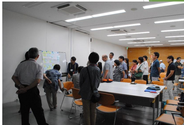
■ 四万十町中高生ワークショップ：ワークショップをするとどんな変化が起きるのか