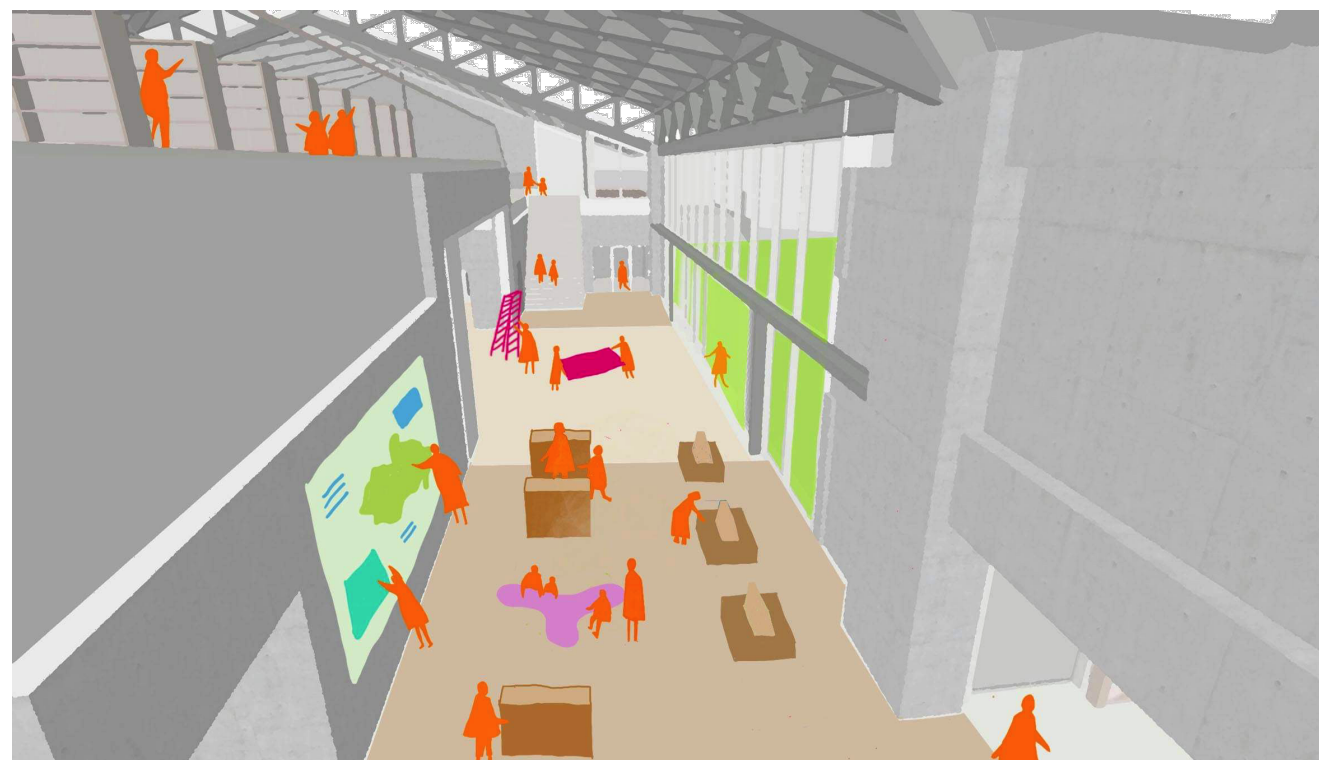
1階 メイン棟 開架書庫より交流コーナー2をのぞむ 「想像／創造体験を通じた自己表現の場」