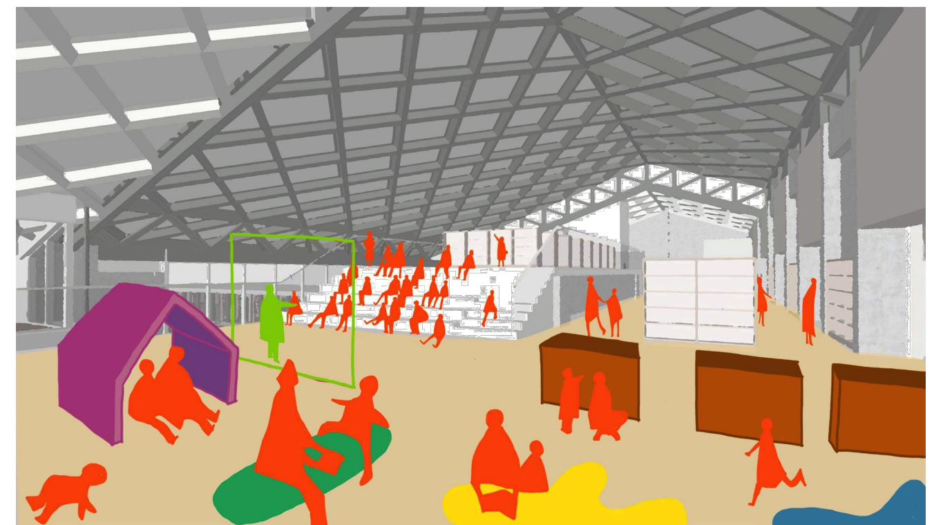
2階 メイン棟 開架A（キッズライブラリー）より東側をのぞむ 「STEAM教育に基づく試行錯誤の場」