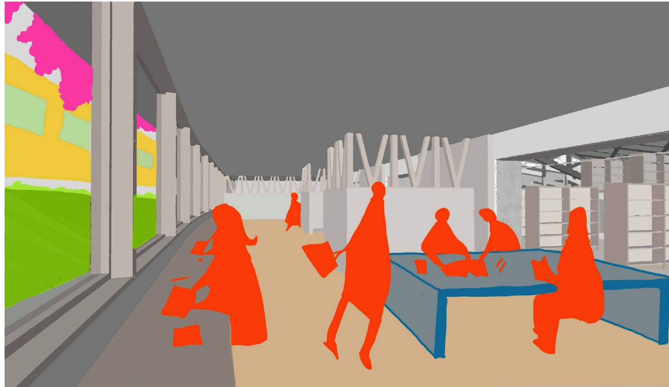
2階 線路棟 開架C（ティーンズコーナー）より西側をのぞむ 「子どもたちが自分の居場所を見つけられる場」