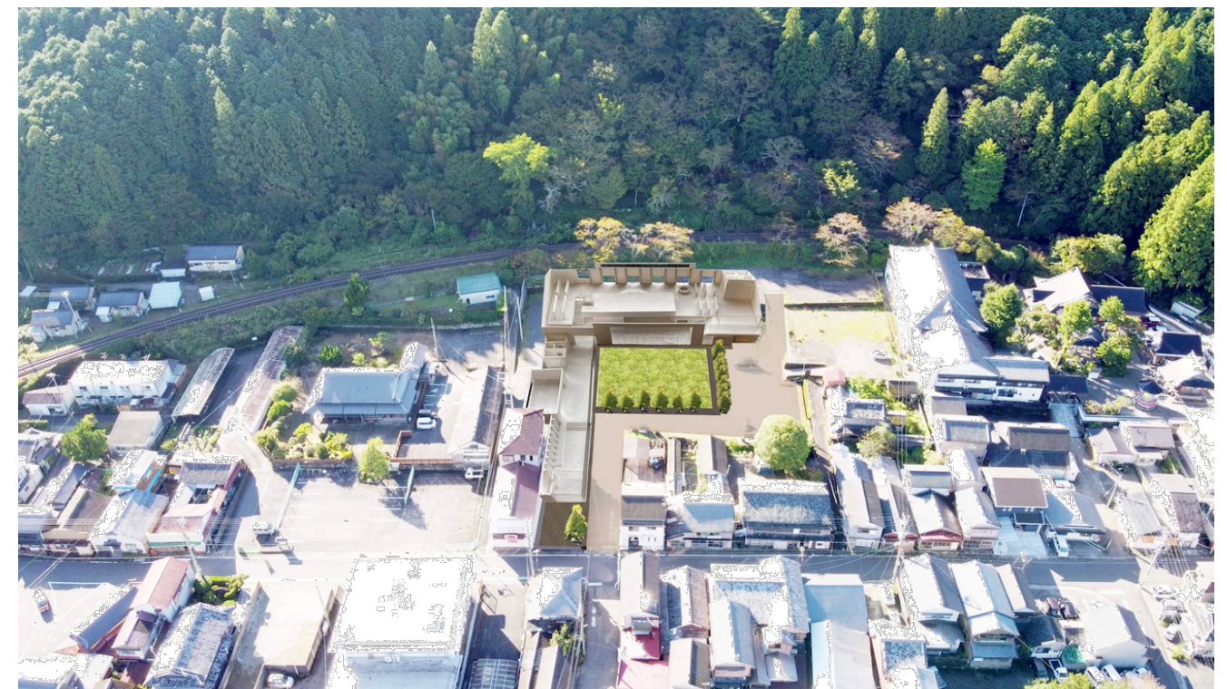
模型写真鳥瞰 (計画地にはめこみ)