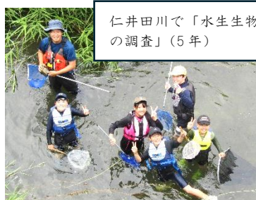
仁井田川で「水生生物 の調査」（5年）