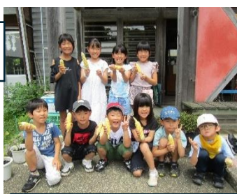
こんなにたくさん採れたよ。 「とうもろこし」（1、2年）