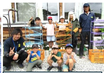
順調に育っています。「コンテ ナしょうが」（3、4年）