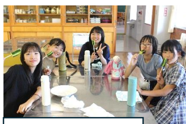
採れたての「きゅうり」 の味は最高！（6年）