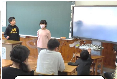
5年生・「総合」防災学習で学んだことのプレゼンをしました。