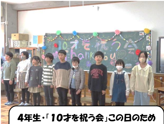
4年生・「10才を祝う会」この日のために一生懸命準備した4年生。感謝の気持ちを伝えました。

2月20日は、今年度最後の参観日でした。それぞれ学年に合った授業参観、また4年生については「10才を祝う会」への出席をありがとうございました。学年長さんをはじめ役員の皆様には1年間大変お世話になりました。今年度も残すところ、20日を切りました。今の学年でできることを最後まで精一杯頑張りたいと思います。