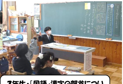
3年生・「国語」漢字の部首について学習しました。