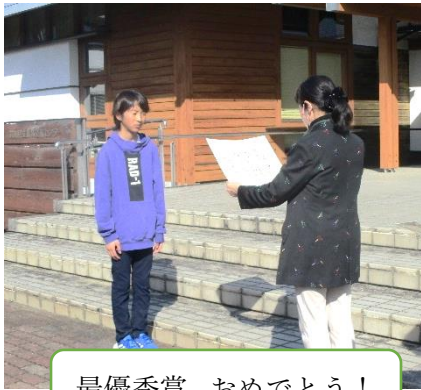
最優秀賞、おめでとう！