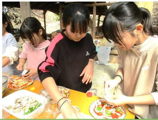
発表大会後は、ピザづくりや丸太切りなどの体験をさせていただきました。