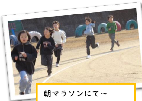
朝マラソンにて～ みんな、真剣です!

月日の流れは本当に早いもので、いよいよ3月。今の学年で過ごす時間も残りわずかとなりました。振り返れば、4月のドキドキしていた表情から一変し、どの学年も自分たちで考え、行動できる場面がぐんと増えてきました。特に6年生は小学校課程の修了を目指して、自分のことはもとより、委員会活動やクラブ活動の引継ぎを下級生に行ったり、休み時間には下級生を楽しませる遊びを発案したりと、最後まで忙しさの中にも下級生のことを思って行動をしてくれています。そして、学習面でも毎日こつこつ自分の課題に向き合って頑張っている人はどんどん伸びてきています。そんな6年生の姿を同じ教室で見ている5年生も最高学年としての自覚が高まっているように思います。上級生の姿から学ぶことをこれからも伝統にしていきたいです。