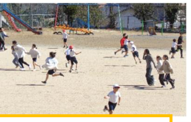
高学年発案の全校遊び みんな、いい顔です!