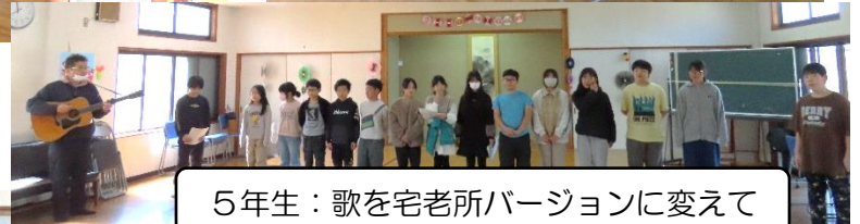
5年生：歌を宅老所バージョンに変えて