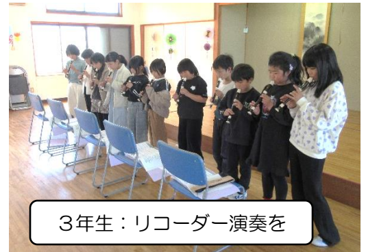
3年生：リコーダー演奏を