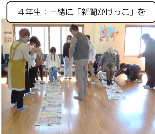
4年生：一緒に「新聞かけっこ」を