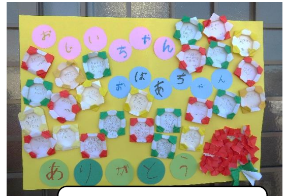
2年生からのメッセージを 宅老所の玄関に

長年にわたり、交流をさせていただいていました宅老所「百花」が閉所されました。「いつでも会いに行ける場所」だと思っていただけに、突然の閉所に子ども達、教職員も残念でなりません。学校に近く、すぐに訪問ができ、心温まる時間を過ごさせていただきました。七夕の時期には笹飾りを、クリスマス前には、ツリーの飾りつけを来所者の皆さんとさせていただきました。その他、体操を一緒にしたり、かるたを楽しんだり、時には歌や踊りを見ていただきました。閉所のお話をお聞きして、3月4日・11日は、全学年が交代しながら訪問をさせていただき、最後の交流を楽しみました。本当にありがとうございました。どうぞいつまでもお元気でいらしてください。そしてまたいつか、開所の日が来ることを楽しみにしております。