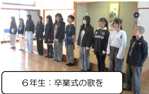
6年生：卒業式の歌を