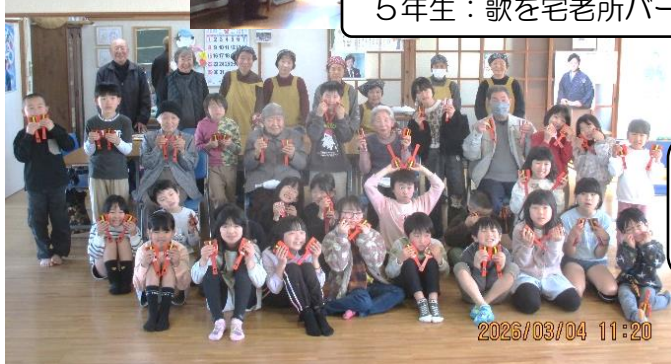
皆さん、 ありがとう！