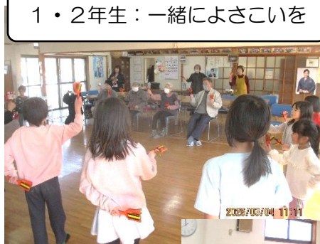
1・2年生：一緒によさこいを