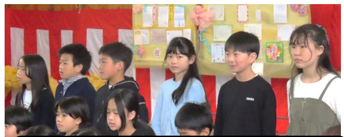
6年生からバトンを渡された5年生