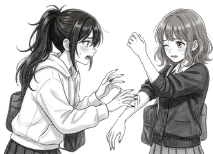
友だちにケガをさせる