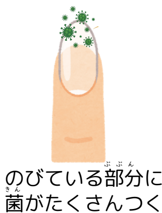
のびている部分に菌がたくさんつく