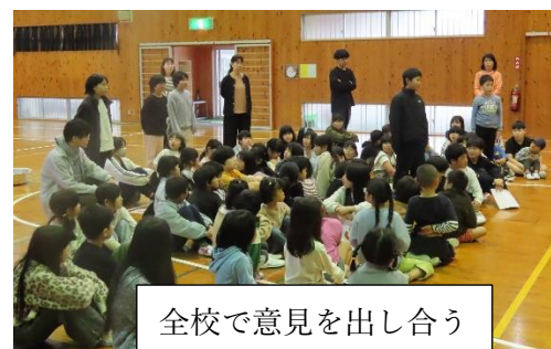
全校で意見を出し合う

4月15日(水)の1回目は、「いじめってなに?」というテーマで話し合いました。子ども達が考える「いじめ」がたくさん出されました。話し合いの後半では、「見て見ぬふりをするのもいじめだと思います」という意見にハッと気づいた子どももおり、振り返りには多くに子どもがこの意見について共感をしていました。最後にいじめをテーマにした紙芝居を読んで子ども達に考えてもらいました。