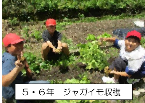
5・6年 ジャガイモ収穫