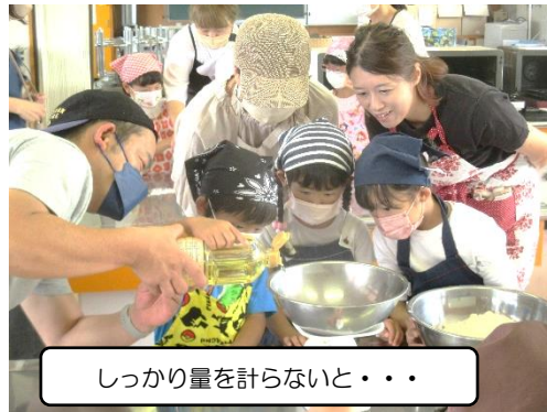
しっかり量を計らないと・・・