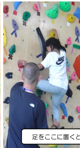
足をここに置くといいよ