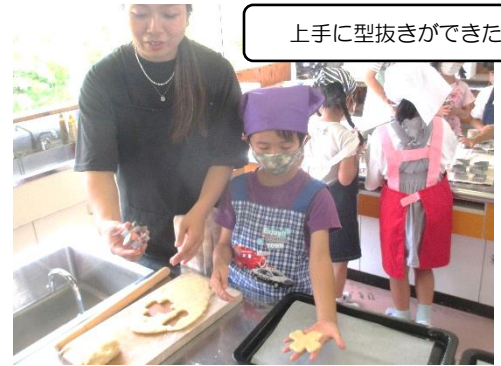
上手に型抜きができたよ