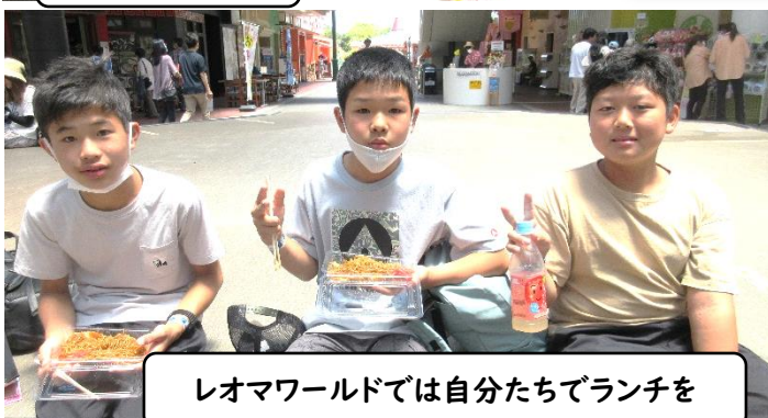
レオマワールドでは自分たちでランチを