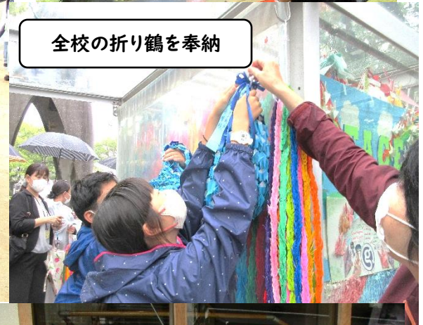
全校の折り鶴を奉納