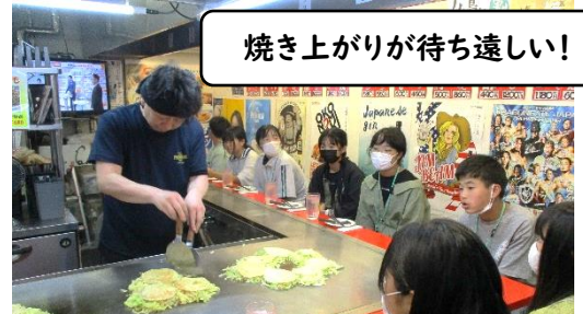
焼き上がりが待ち遠しい!