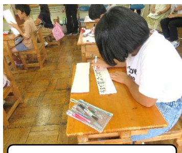
自分の取り組みを書く