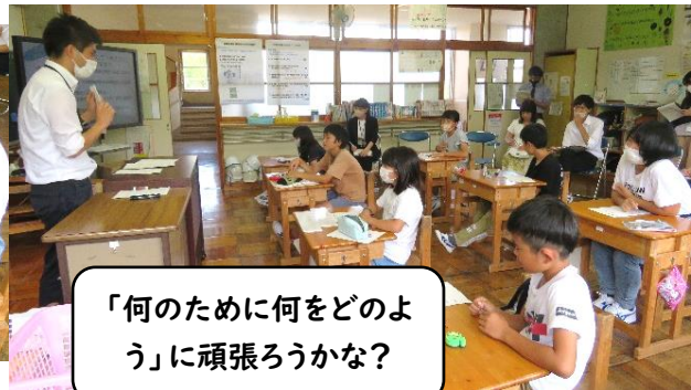
「何のために何をどのように」に頑張ろうかな？