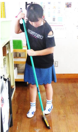
丁寧にゴミを集めています