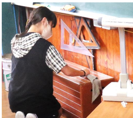
「すみずみまで」できています