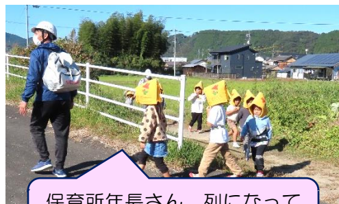
保育所年長さん、列になって小学校敷地内へ無事避難