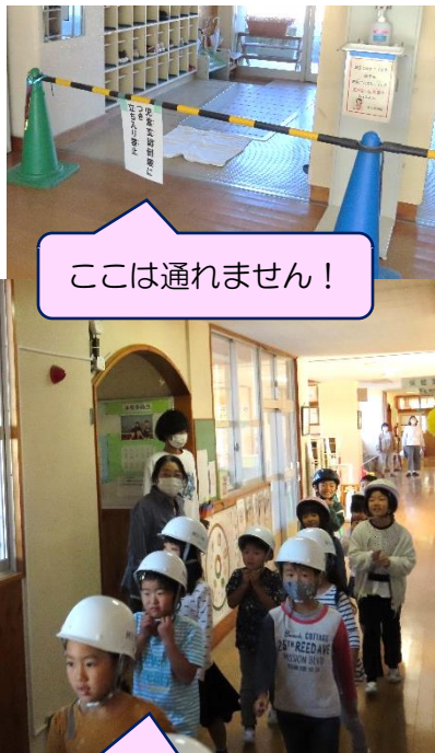
ここは通れません!

10月25日(水)、地震避難訓練を保育所と合同で実施しました。この日の地震避難訓練では、児童玄関が通れない設定で行いました。それぞれ子ども達が考え、職員玄関や給食搬入用出入り口から避難することができました。前回の訓練より、「お・は・し・も」を守った行動がみられました。東又保育所全園児の他、来年の入学を見据えて興津保育所4・5歳児さんも一緒に行いました。年長さんを先頭に静かに列になって小学校運動場まで避難できました。