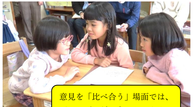
意見を「比べ合う」場面では、グループで話し合いもします