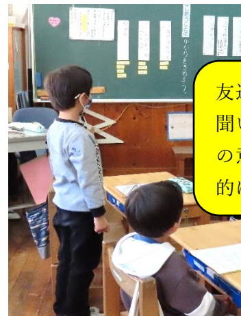
友達の考えも聞いて、自分の意見を積極的に述べます