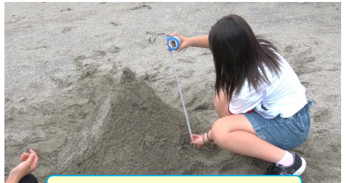
この班の砂山は何センチかな?