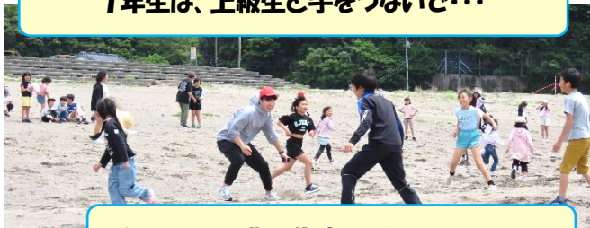
鬼になった、豊田先生!だれにタッチを?