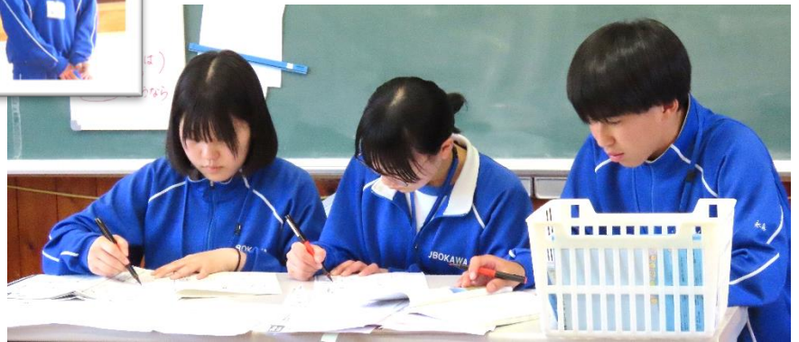
授業参観や丸付け、一輪車練習の補助、草引きなど様々な体験をしました