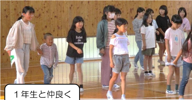
1年生と仲良く 手をつないで

「だるまさんがころんだ!!!」と鬼が振り向いた瞬間のポーズがとっても可愛いです。動きを見逃さない鬼の場合はたくさん呼ばれて前に集まっていました。