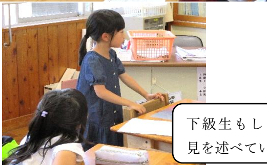
下級生もしっかり意見を述べています