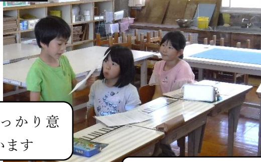
全校レクの日が待ち遠しいですね