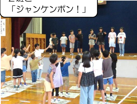
2班と 「ジャンケンポン!」