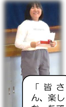
「皆さん、楽しかったですか?」