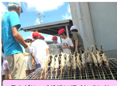
名人がじっくり焼いてくれました