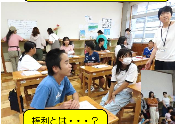
権利とは・・・？ どんな優先順位 を？