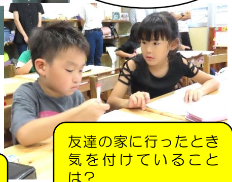
友達の家に行ったとき 気を付けていること は？