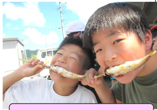
美味しさが伝わってきます！