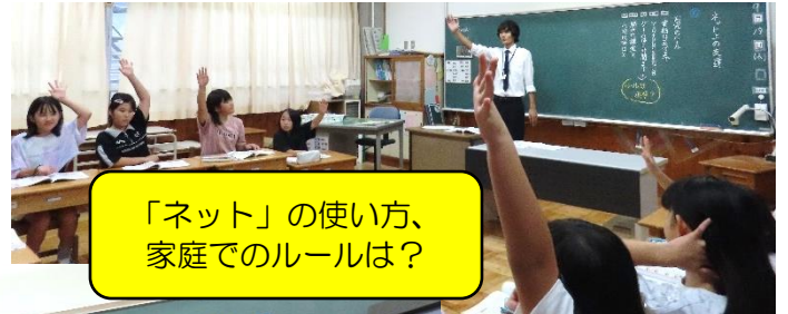
「ネット」の使い方、 家庭でのルールは？