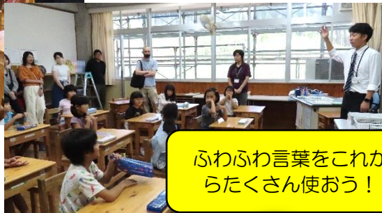
ふわふわ言葉をこれか らたくさん使おう！