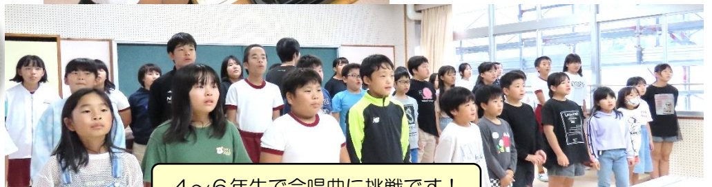
4~6年生で合唱曲に挑戦です!