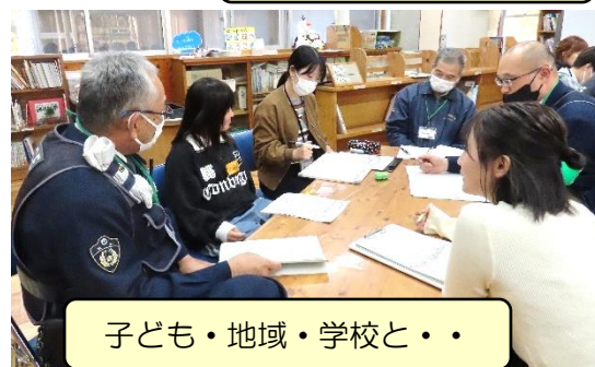
子ども・地域・学校と・・・