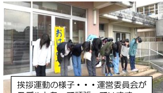
挨拶運動の様子・・・運営委員会がモデルとなって頑張っています

三学期も上級生を中心に学校が一つにまとまり、子ども達、教職員、保護者の皆さんが一体となり地域の皆さんの力も借りながら、頑張っていきたいと思っています。