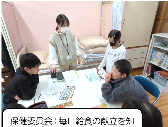
保健委員会：毎日給食の献立を知らせる仕事があります

委員会活動も6年生から3年生へ引き継がれます。3月5日(水)には、3年生も見習い期間に入りました。児童数の少ない東又小学校では、4～6年生が学校全体の委員会活動を分担しています。どの委員会も全校の学校生活をスムーズに送るためになくてはならない活動です。委員会によっては、「何曜日の何時から」や「いつの休み時間」など担当が決まっている場合があります。特に始業前に任されている委員会については、登校が遅れることのないよう、声かけや車での送り時間厳守をお願いします。