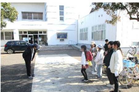
今年は清掃範囲を広げB&Gからスタートしたチームも！

3月7日(金)4～6年生児童、保護者の方、地域の方と一緒に地域別に分かれてちりばさみやビニール袋を持って東又校区の清掃活動を行いました。ペットボトルや割れた瓶、強風で飛んできたビニール類などたくさん拾いました。例年参加くださっている地域の方には「いつも同じところに赤いカンが置かれています」という情報も聞きました。誰もが自然豊かで美しい町であることを願っています。この活動を通して、「町をきれいにしたいな」「自分のゴミは家のちり箱へ捨てる」意識も再確認できたことと思います。みんなの力でいつまでも美しい町を守っていきましょう！