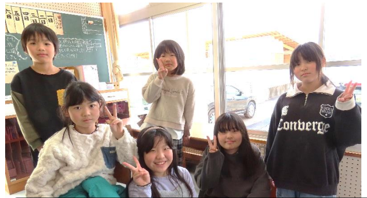
放送委員会：5分前行動は必須。アナウンサーのように原稿がスラスラ読めるように頑張ってください！