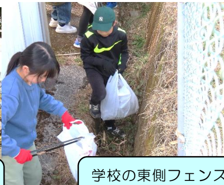
学校の東側フェンスの内側にも意外とゴミが・・・