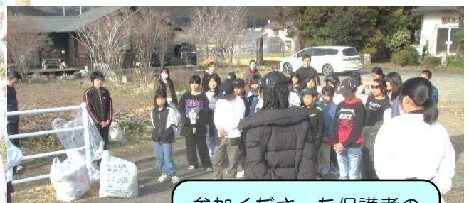
参加くださった保護者の皆様、地域の皆様ありがとうございました